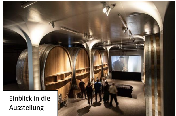
Einblick in die Ausstellung

Nach einem kurzen Zwischenhalt führt uns der Weg weiter Richtung Pfauenmoos, Hahnberg ins Weiherholz (Tälisberg). Nochmals geniessen wir bei der Feuerstelle die erhöhte Aussicht über Arbon. Nun lenken wir unsere Schritte saisongerecht der Mosterei Möhl zu, wo die Möglichkeit besteht, das Mostereimuseum Momö zu besuchen.