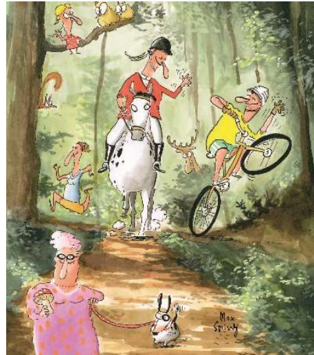
Wir respektieren einander

Den ganzen Wald-Knigge können Sie unter www.waldknigge.ch einsehen und in beliebiger Anzahl bestellen oder herunterladen. Er ist übrigens auch für die Schule geeignet. Mehr Infos zum Wald unter: www.waldschweiz.ch