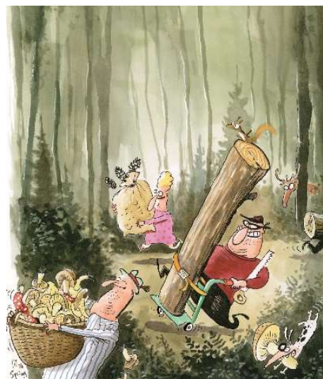
Wir sammeln und pflücken mit Mass