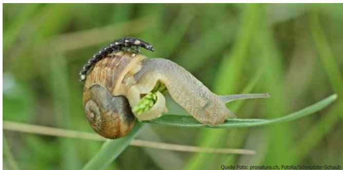
Larve eines Glühwürmchens: Ein geborener Schneckenjäger

Das Leuchten der Glühwürmchen macht dunkle Nächte zu etwas Magischem. Genau genommen handelt es sich bei diesen leuchtenden Tierchen um eine Käferart – bei uns meistens um den Grossen Leuchtkäfer.