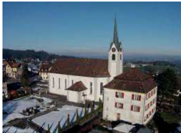
Kirchplatz in der Engelburg.

Dieser findet an der Sitter statt. Gestärkt marschieren wir dann anschliessend weiter flussaufwärts über das Erlenholz Richtung Engelburg. Nach einer weiteren Pause erreichen wir das Dorfzentrum. Nun steht noch der kurze Anstieg zum Hohfirst an.