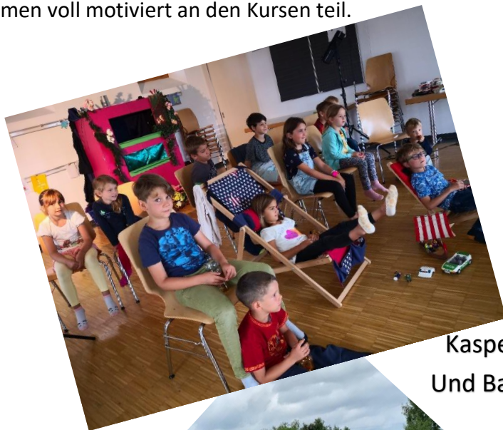
Kasperlitheater Und Ballonfiguren

Insgesamt haben sich 64 Kinder angemeldet und es gab 135 Kursbuchungen. Die Kinder von klein bis gross nahmen voll motiviert an den Kursen teil.