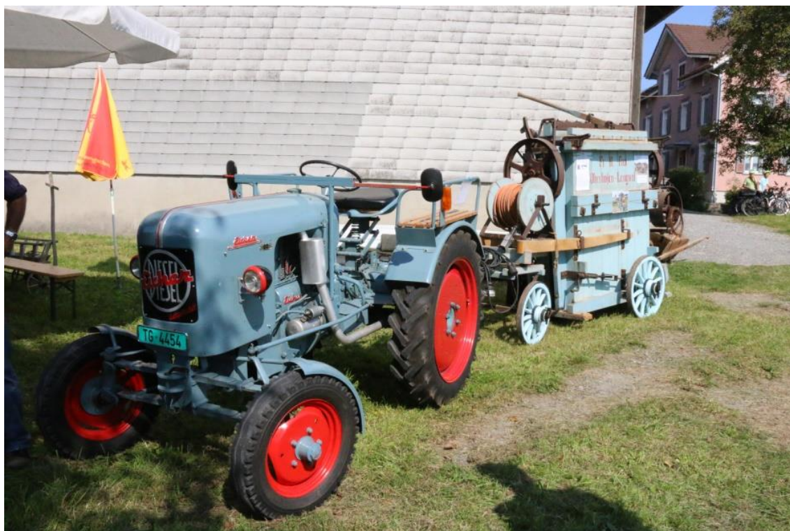
Antike Strohballen- presse