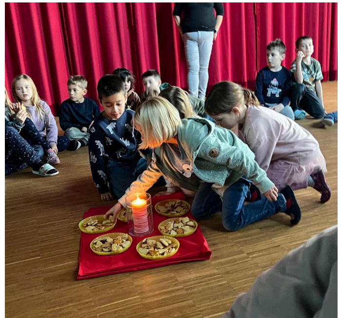
Text und Foto: Jil Hoffmann, Lehrperson

Das grosse Highlight waren jeweils die Montagmorgen, an denen sich alle Kinder vom Kindergarten bis zur 6. Klasse neben dem festlich geschmückten Christbaum versammelten und sich gemeinsam auf Weihnachten einstimmten. Dafür gestalteten jeweils eine oder zwei Klassen das Programm und bereiteten etwas Besonderes für die anderen vor. Wir durften viele schöne Weihnachtslieder von den 3./4.-Klass-Kindern hören und erfahren von der 5./6. Klasse interessantes über Weihnachtsbräuche in anderen Ländern. Ausserdem führten die 1./2.-Klass-Kinder Theaterstücke auf und bereiteten ein spannendes Hör-Quiz mit adventlichen Geräuschen vor. Diese stimmungsvollen Treffen waren für alle eine schöne Gelegenheit Gemeinschaft zu erleben und die Vorfreude auf Weihnachten zu teilen.