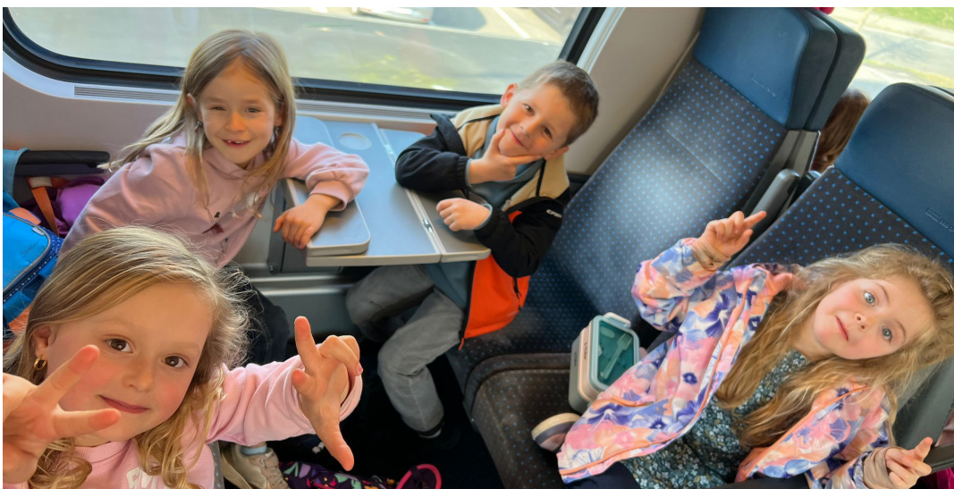
Text und Bilder: Noëmi Wiggenger, Lehrperson