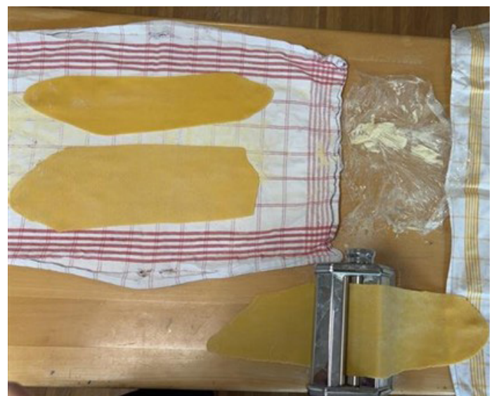
Text und Bild: Ilenya Esposito